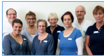
Praxisteam Orthopädie Waldweg