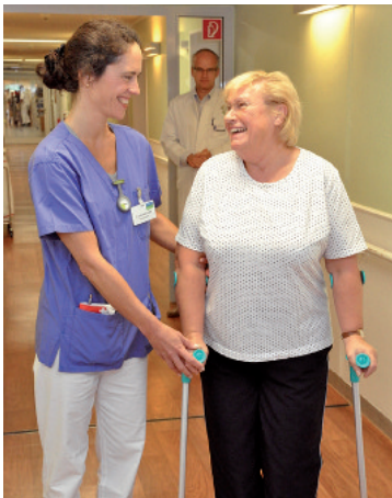
Betreuung vor Ort, z. B. im Ev. Amalie-Sieveking-Krankenhaus in Volksdorf