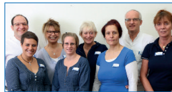
Praxisteam Orthopädie Waldweg